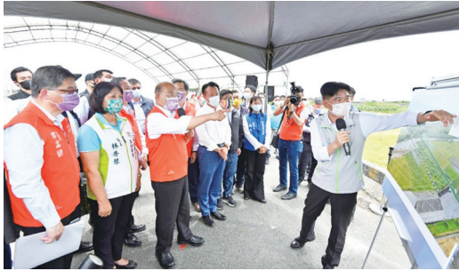
【圳水長流】-111年6月17日行政院長蘇貞昌視察濁幹線與北幹線串接工程計畫