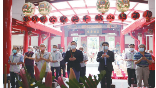
【認同覺醒】-111年11月1日於曹公廟曹公236週年聖誕慶典