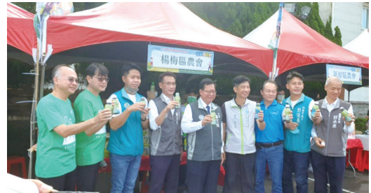
【公私協力】-石門管理處與農會合作推廣在地農特產品，推動食農教育