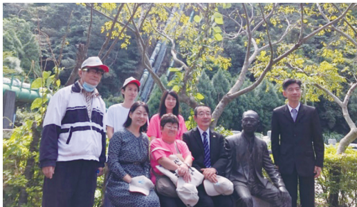
【認同覺醒】-111年10月15日白冷圳通水90週年紀念文化祭