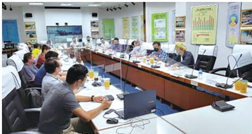
【公私協力】-111年8月16日水圳綠道第二階段優化研商會議，邀集當地縣市政府、區公所及里長進行需求及溝通