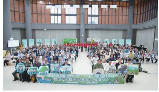
【職入薪傳】-111年11月29日本署桃園管理處辦理古圳專題演講暨專書成果發表會