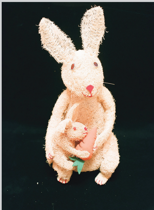
用絲瓜絡形塑捏造的動物造型