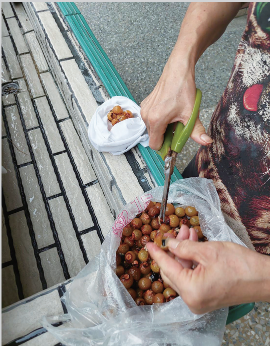
將黃目子的殼剪開

在亞洲地區用到20世紀初才逐漸被肥皂等清潔劑取代。黃目子與荔枝跟龍眼同屬無患子科，難怪果實很像龍眼。