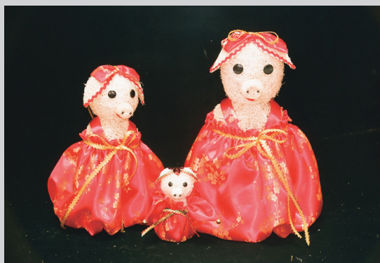
絲瓜絡製成的手工藝品

開發面膜、護膚等多種絲瓜保養美容用品，也有素人藝術家以絲瓜絡材料進行藝品創作，一開始以平面靜物為主，後來加入做花燈的技巧，內部先架鐵絲當骨架，開始創作立體的動物包括農村常見的牛豬等造型。