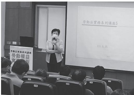
參加勞基法實務系列講座