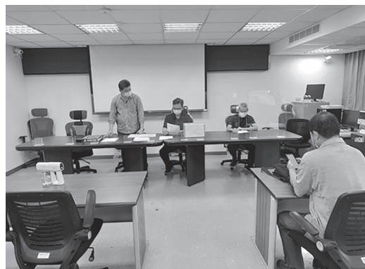
太陽光電設置招商資格審查程序說明

上午，辦理後龍圳幹線等2處圳路上土地設置太陽光電發電招商資格審查會議，本次規劃設置場域計有後龍圳幹線(後龍鎮新興段1地號)、及水尾大排(後龍鎮外埔段1625-10地號)等2處，經開會審查結果由日煬科技有限公司取得資格，本處將擇期通知廠商參加評選會議。(林清華)