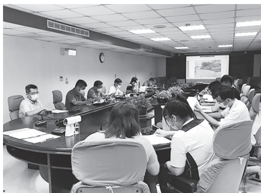
查估委員進行不動產售價討論