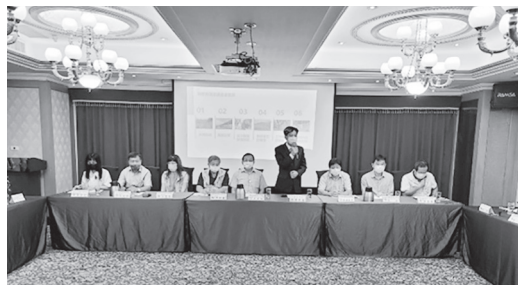
蔡署長於聯席會議致詞