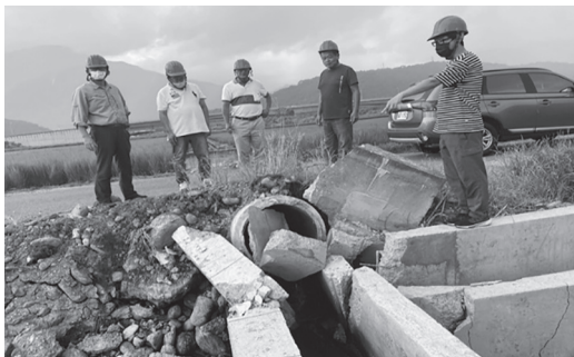
大禹圳6支線渠道斷裂崩塌

農田水利署花蓮管理處公告(一)為配合「玉里鎮永安、永林段農水路改善工程(第四期)一工區」工程施作，自111年11月1日上午8時起至112年1月10日下午5時止，玉里長良2幹線灌區