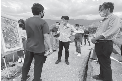
署長在破損隆起的農路上聽取災情簡報