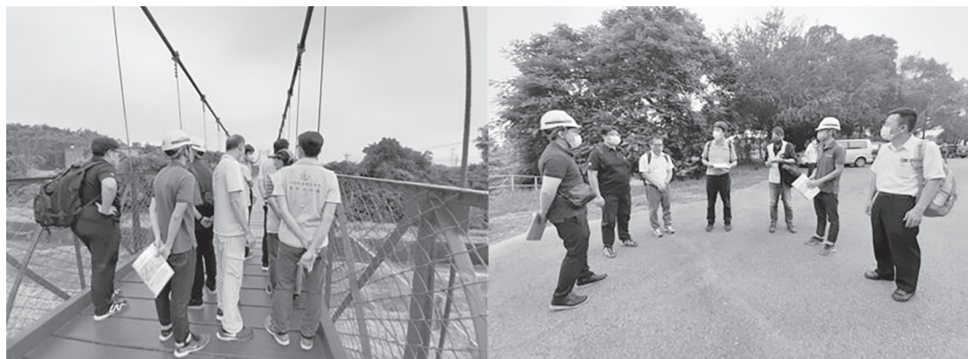
橋樑養護管理執行督導

農田水利署嘉南管理處辦理水利小組長國內考察行程，有中部地區及台東、屏東三天二夜等2案，各分處活動期程如下(1)中部地區：白河水庫分處自9月26至9月28日、麻豆分處自10月18日至10月20日、嘉義分處自10月25