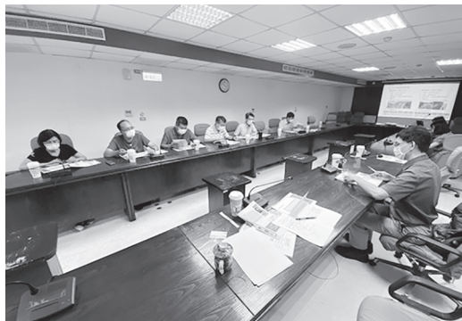
財產盤點業務簡報