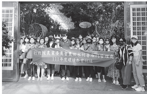
辦理環境教育訓練

農田水利署石門管理處辦理「111年環境教育訓練」，於8月29日至8月30日及9月1日至9月2日共辦理兩梯次，前往宜蘭縣分別為蘭陽博物館、船遊龜山島繞島、香草菲菲芳香植物博物館、龍潭湖畔悠活園區、宜蘭傳統藝術