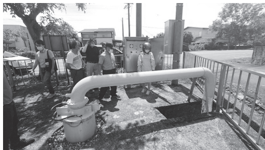
現地勘查抗旱水井

農田水利署宜蘭管理處於9月5日至9月7日，舉辦三天兩夜水利基層組織農業技術觀摩及交流座談會。