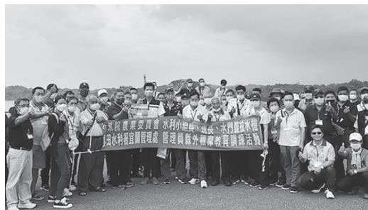
基層幹部參訪烏山頭水庫合影

本次活動不但提升農業專業知能、增廣見聞，基層組織人員亦藉此機會互相交流，以利推動農田水利署改制後相關政策及便民措施。(吳信昌)