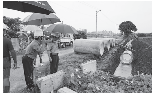
緊急以高壓涵管搶修供水