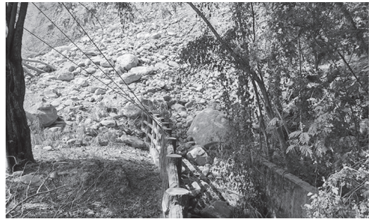
美國圳圳路受震損壞情形

模6以上的淺層地震，關山鎮、鹿野鄉、池上鄉、海端鄉、延平鄉更因為災情嚴重，於9月19日停止上班、停止上課。