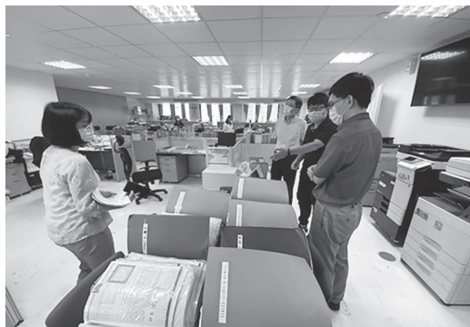
鄭視察至各組室進行財產盤點