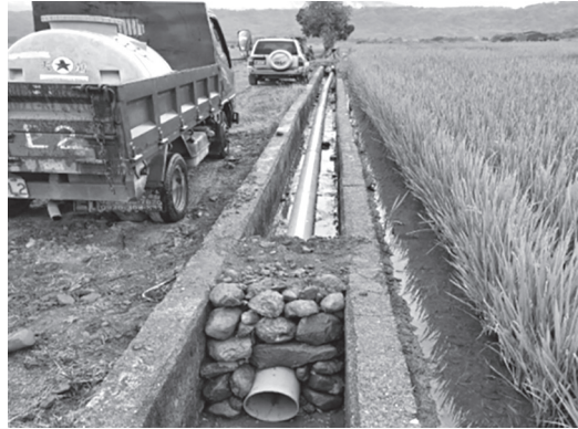
災損設施迅速搶修通水

期。(二)災後復建工程應迅速進行測設、規劃，以利復建執行。(三)玉里松浦重災區，以設置專案方式辦理，農地隆起、凹陷無法灌溉部份，應先行設法引水灌溉，減輕農民稻作損失。(彭麗華)