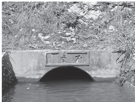
吉安圳不盡跌水井

農田水利署花蓮管理處列管歷史建物有吉安不盡跌水井等3處。配合文化部於9月17日至18日，辦理「2022年全國古蹟日活動」供民眾參觀。該三處建物皆為日治時期、官營移民村為灌溉農