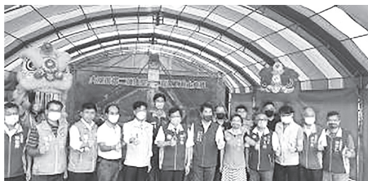
灌溉農水路整治等工程開工動土典禮

桃園市政府辦理「大溪低揚二號池及灌溉農水路整治工程」於9月13日舉行開工動土典禮。鄭市長表示，低揚灌區位於龍潭、大溪地區，市府獲行政院農田水利署補助，辦理「桃園高低揚地區擴大與創新灌溉服務之示範推動計畫」，除了示範區推動外，針對低揚二號池進行整治，總經費約4,592萬餘元，由行政院農田水利署補助3,857萬餘元，市府自籌款734萬餘元，總工程面積約1.4公頃，預計進行池體坡面改