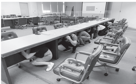
員工地震講習演練活動

農田水利署彰化管理處於9月21日上午，假本處二樓會議室，舉辦「111年度總務組員工地震避難演練活動」，