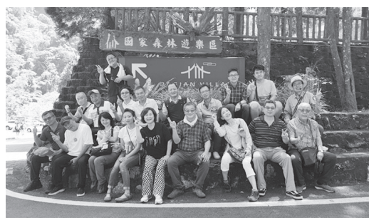
諮議委員八仙山森林環境觀摩