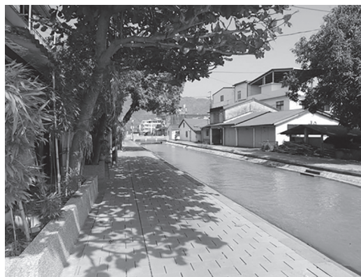
獅子頭圳為美濃區灌溉重要渠道

近日有民間社團辦理美濃泛舟漂漂河活動，農田水利署高雄管理處於9月16日發布新聞，重申漂漂河活動原則上不會禁止，但請民間社團向本處提出，以免未經申請許可擅入農田水利設施水域戲水、或從事水上活動發生危險；因為獅子頭圳為美濃區灌溉重要渠道，水流湍急、含砂量高，渠底常有淤砂、水