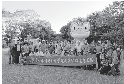
志工團觀摩桃園八德埤塘自然生態公園

水公告上傳知本工作站臉書專頁中，讓更多農民知悉，提早做好準備，將因通斷水帶來的不便降到最低。 (朱文靜)