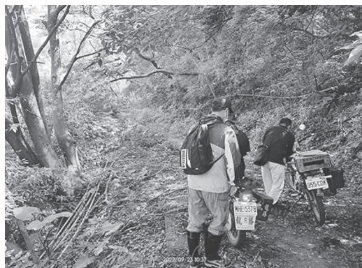
屏東縣春日鄉履勘人員機車上山

農田水利署屏東管理處辦理無需保留非事業用地處分，於9月29日召開本處111年第2次不動產處分查估小組會議，由召集人王副處長主持，查估小組委員全體出席，本次查估土地包括座落潮州鎮潮中段269地號等13筆報廢圳路地之出售價格與處分方式，小組委員在財務組引導下實地履勘後逐一評訂出售底價，俟報奉農田水利署核覆同意再擇期辦理標售。(沈明章)