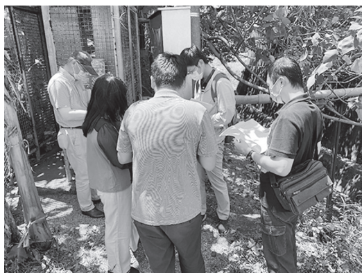
經濟部水利署抗旱水井抽樣檢查

屬設施)功能抽樣檢查，抽查新竹站轄管虎林抽水井，新竹工作站除配合辦理並提前於完成現地整備工作，抽查作業順利進行。