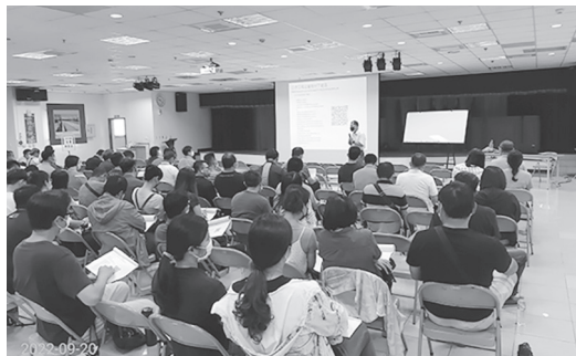
辦理工程教育訓練