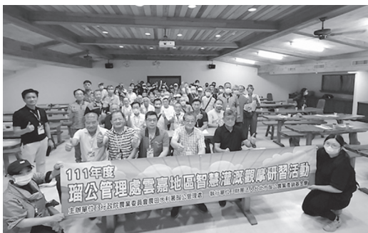
辦理「水利小組業務交流會議」

術，藉由三天二夜活動分別辦理灌溉技術優化、及智慧灌溉應用推廣教育訓練，內容包含灌溉省水技術、智慧灌溉推動現況、永續農業發展、節能減碳、配合政府政策與相關農業技術優化等議題，藉此提升農民投入農業之意願與技術運用轉型之實務知能，進而達到農民生產收入增加及推動永續農業目標。另為使本處事業區農民意見可以順利交流，爰辦理水利小組業務交流會議，藉由會議充分討論本處事業區內從事農業生產遭遇的相關問題，以該處作為未來業務推動參考使用。本次教育訓練參加人數為75人次。