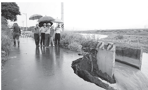
「自立圳」幹線遭河川沖毀95公尺

九月初「軒嵐諾颱風」造成農田水利署新竹管理處轄區內部份灌溉圳路受損，其中竹北「自立圳」幹線遭河川沖毀95公尺，影響農地灌溉面積130多公頃最為嚴重，本處林處長獲報後立即前往勘災，指示最快的時間搶修通水，確保農業用水無虞。林處長與相關單位會勘後表示自立圳靠近主要河川頭前溪，常受主流沖刷凹岸，已漸次沖刷掏空，為穩定供水，應就地勢往內遷移遠離河岸，並請工程單位即起積極協調取得工程用地規畫施作，讓農民無後顧之憂。（葉世祥）