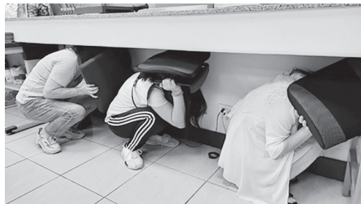
地震避難掩護演練

為提升員工地震避難之知識與技能，農田水利署雲林管理處於9月21日「國家防災日」，假本處大樓實施地震避難掩護演練，宣導本處同仁平時備妥緊急避難包，當地震發生時應保持鎮定，若在室內立即採取抗震保命三步驟：「趴下、掩護、穩住」，保護頭、頸部及身體，盡可能找桌子等較為穩固的傢俱就地掩護，以防燈具、吊扇、水泥碎片等懸吊物掉落，造成二次傷害，若在室外應立即蹲下就近找掩護，等地震稍緩後，遵守「不語、不跑、不推」原則進行避難疏散，透過實地地震防災避難演練，建立正確的防震觀念，強化災害應變能力以確保自身安全。