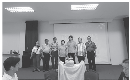
辦理水利小組長、班長慶生聯誼活動

農田水利署石門管理處111年度水利小組國內考察活動，在9月份分梯辦理，八德站與楊梅站於9月14-16日，