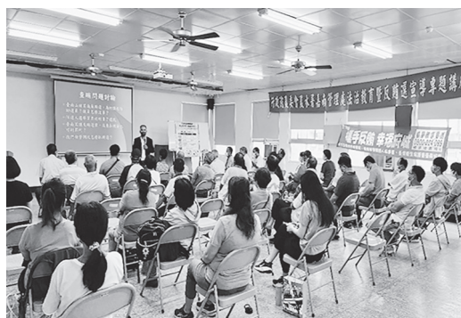
法治教育暨反賄選宣導專題演講

呼籲大家小心謹慎，勿使選票變傳票，創造優質乾淨選舉環境，須全民齊心防制假訊息、暴力及金錢介入選舉，如遇有賄選情形，請撥打檢舉專線：0800-024-099，安心檢舉，身分絕對保密！檢舉賄選獎金最高可拿新臺幣一千萬元！反賄選，斷黑金，檢舉賄選，人人有責！ (侯雅芬)