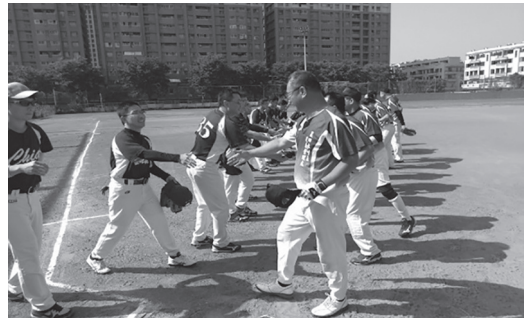
壘球交戰隊員先禮後兵

第57屆農田水利杯錦標賽於9月24日，假台南市國立成功大學光復校區田徑場及周邊場地舉行一天，參賽單位有農委會、農田水利署及所屬17個管理處和農工中心等20個單位，比賽項目有網球、桌球、羽球、慢速壘球、槌球及趣味競賽等6項，參賽單位組成119支隊伍參賽角逐39個獎額。