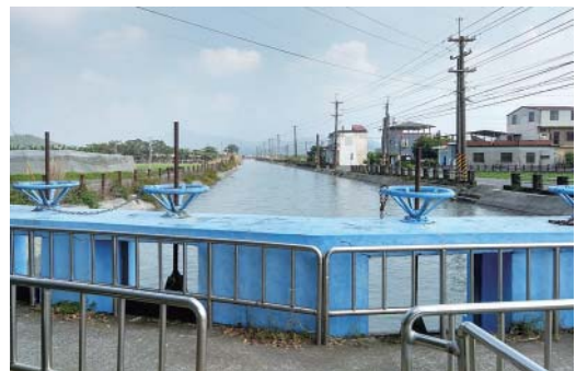
圖4 第一幹線與第二幹線分水門一十穴