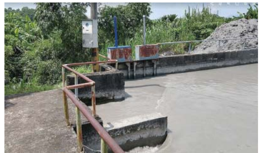
圖3 獅子頭圳導水幹線及其排砂洩水施