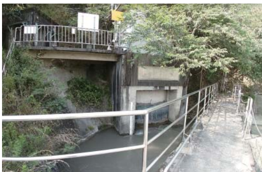
圖2 獅子頭圳與竹仔門電廠共同取水

獅子頭圳取水、導水幹線、分水位置周邊古、今地圖(如圖1)，其中，取水口係與台灣電力公司共管(如圖2)，其臨時擋水壩設施經常因洪水需要修復。導水幹線亦設有排砂洩水設施(如圖3)，重要分水門處當地稱為十穴，是美濃最重要的水閘門，北邊四道門，屬於第二幹線水路，南邊六道門，屬於第一幹線水路(如圖4)；聚落現況風貌(如圖5)。