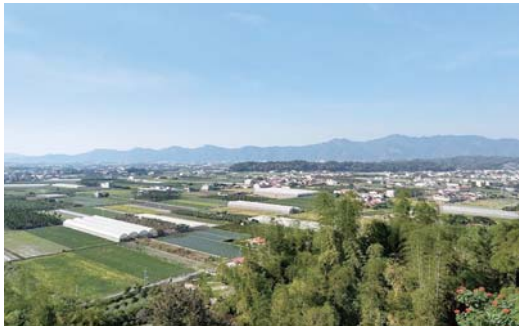
圖5 獅子頭圳灌區風貌

河川流量約每秒186立方公尺，枯水期則約每秒45立方公尺，豐枯差異大，現況亦採抽水井進行補充灌溉，地下水用水占比不到總用水量一成。