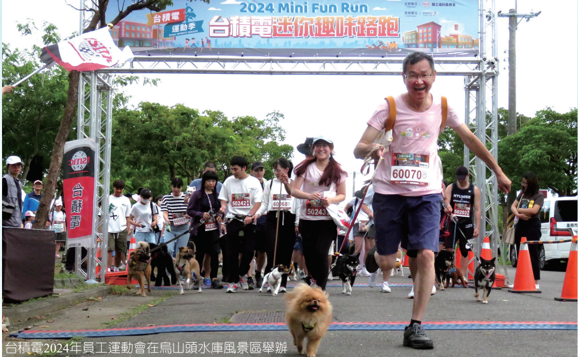
台積電2024年員工運動會在烏山頭水庫風景區舉辦