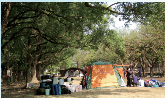
烏山頭水庫風景區也是露營的好所在