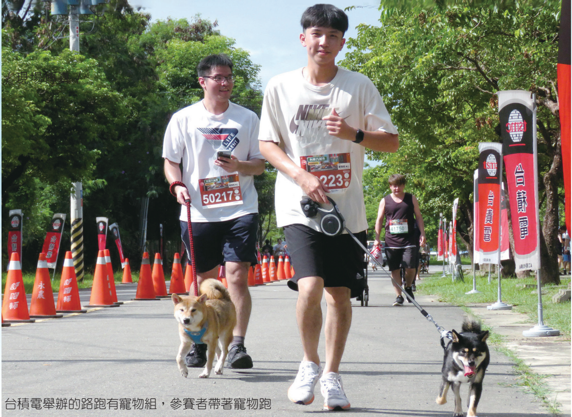
台積電舉辦的路跑有寵物組，參賽者帶著寵物跑

著季節接續綻放。最特別的是大壩下方有一排南洋櫻，三月下旬綻放，淡粉色花朵綿延粉黛，層層疊疊非常壯觀，被遊客美譽為「香樹大道」。陣風吹來，花瓣飄落如鋪上粉紅地毯，遊客漫步在步道上，如置身粉紅色世界中，浪漫度破表，成為情侶最愛攜手漫步的聖地。