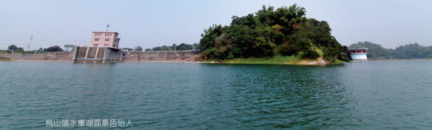
烏山頭水庫湖面景色怡人