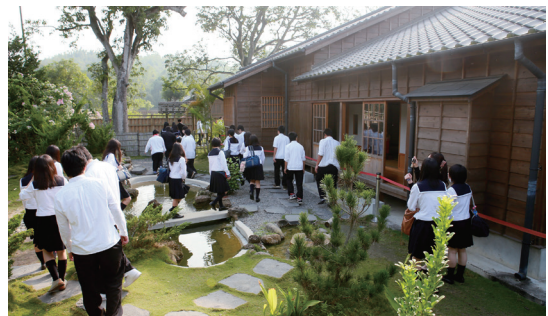
八田與一紀念園區

近年來吹起露營風，體驗另類旅遊感受，初次露營者都會選擇路程不遠、交通方便且水電生活設施齊全的營地，價錢當然也要便宜，不管上網或口耳探聽，烏山頭水庫風景區是台南地區絕佳的選擇。帳篷搭好營地整備之後，大人可以到大壩健行欣賞湖面