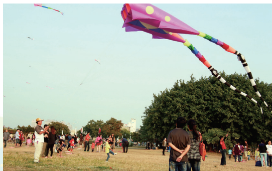
2014年在園區舉辦的風箏表演