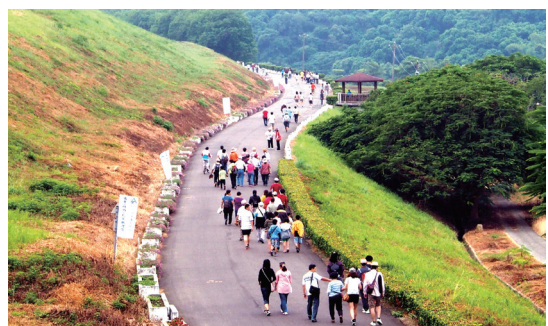
園區面積寬闊，很適合辦健行路跑等活動

風光，到八田與一銅像悼念緬懷嘉南大圳之父，而八田與一紀念園區更能重現1920至1930年興建水庫的時光場景。