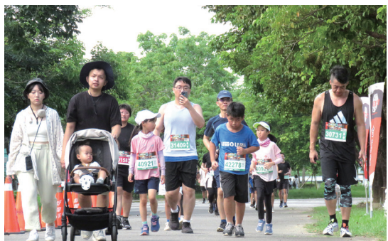
烏山頭水庫風景區綠資源豐富，適合夏天辦活動

風鈴木、鳳凰花、木棉、花旗木及高山櫻花等盛開時，網路滿是PO文圖片。嘉南管理處員工說，在水庫風景區除上述花樹以外，尚有羊蹄甲、火焰花、豔紫荊、洋紫荊等隨