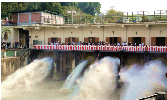
電影KANO以烏山頭水庫舊送水口為場景