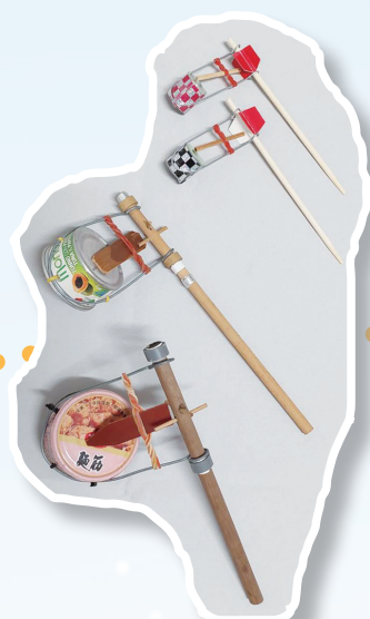
「有酒矸尙賣嘸」的發音器(下)古早原版(上)現代改良版

無人問，行到田中央，行到田中央，為著顧三頓，顧三頓，不驚田水冷酸酸。無論風與雨，或是天晴晴，一家大甲小，熱時去播種，無論寒與熱，每日拼無停，拼無停，央望冬頭通收成」。高手在民間的吳柳青，透過創意豐富淳樸平凡的日出而做日落而息農村生活，心繫日趨式微的傳統民俗技藝