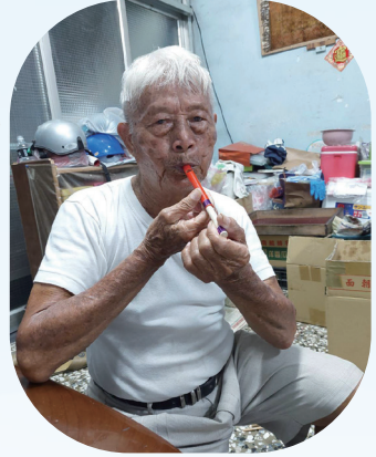
吹起高低音的魔音笛

童玩，足跡遍及南北，這些年還揹起童玩行囊，走入人聲鼎沸的傳統菜市場，用一張張火車敬老票根喚起童心，殷勤的將畢生心血散播各方，呼朋引伴，攜手一起保留逐漸失傳的正港台灣味。