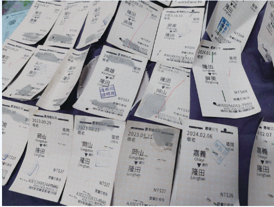
揹起童玩行囊，一張張火車敬老票根