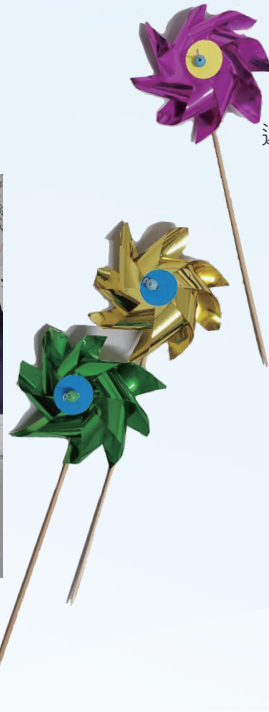
迎風轉動，風吹呀風吹！