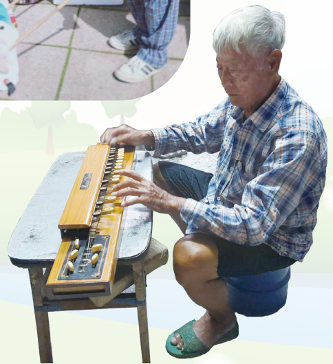
笑談人生的彈奏日本大正琴