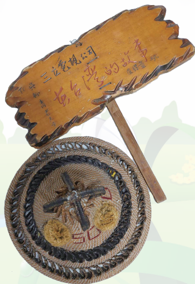
手工藤帽編織在台灣的故事

無人問，行到田中央，行到田中央，為著顧三頓，顧三頓，不驚田水冷酸酸。無論風與雨，或是天晴晴，一家大甲小，熱時去播種，無論寒與熱，每日拼無停，拼無停，央望冬頭通收成」。高手在民間的吳柳青，透過創意豐富淳樸平凡的日出而做日落而息農村生活，心繫日趨式微的傳統民俗技藝